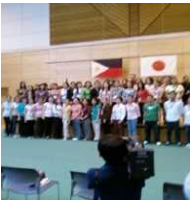
開講式:ひろしま国際プラザ

2009年に入り、日本・フィリピン経済連携協定に基づき、看護・介護の分野におけるフィリピン人看護師（候補者）、フィリピン人介護福祉士（候補者）を受け入れる枠組みがスタートしました。当会は2009年1月に標記受け入れについての説明会に出席し、正式に国際厚生事業団（JICWELS）を通じて求人側施設としてエントリーしました。一方求職側の現地での窓口としては、フィリピン海外雇用庁（POEA）にて求職者のセレクト（選定）を行っています。その後、具体的に求人希望者側と受け入れ施設側のマッチングに参加することとなりました。POEAより300名余りのリストが届き、求職希望者の年齢をはじめとした適性検査の結果表、成績証明書、JIKWELSが面接した際の考課ランクが添付されてお