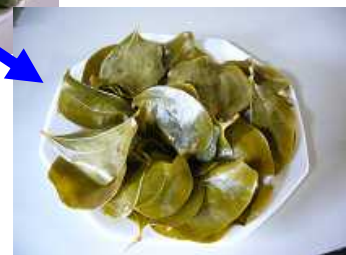
蒸したら緑色のかたらの葉もこんな色に