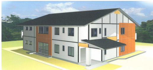
小規模多機能ホーム・グループホーム “ふきのとう” 竣工図

平成5年4月にゆうあいホームが開設されて、15年目を迎えました。開設当初よく耳にした言葉は「高齢者保健福祉十カ年戦略」（いわゆるゴールドプラン）で医療・保健・福祉の連携という言葉もよく聞きました。また、在宅3本柱といわれ施設サービスから在宅サービスへの転換とも言われたのもこの時期ではなかったかと思いません。