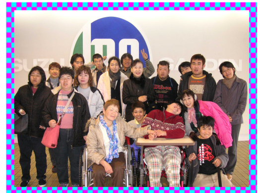
ボーリング&昼食後の参加者全員の集合 写真：寒かったけれど楽しかったね。また行きましょう！